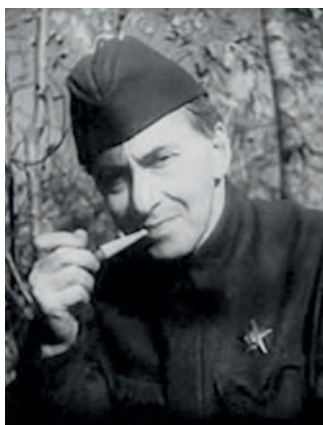
Эренбург Илья Григорьевич