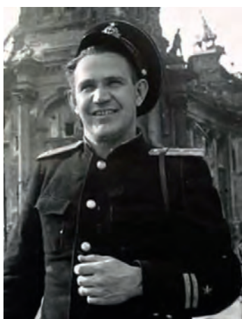
Халдей Евгений Ананьевич