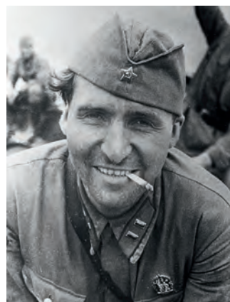
Симонов Константин Михайлович