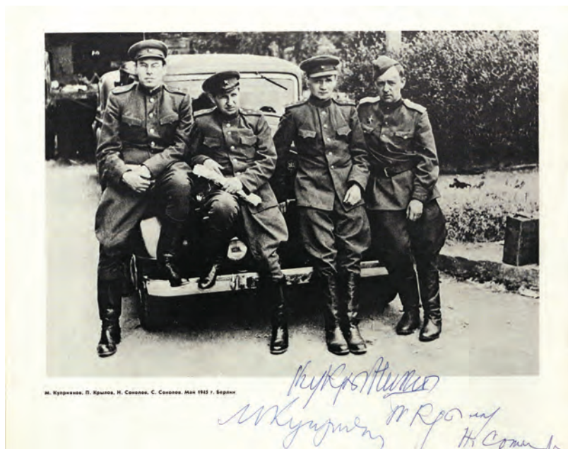
Кукрыниксы в Берлине 1945 г.

Муса Джалиль (Муса Мустафович Джалилов, 1906–1944). Родился в селе Муштафино в бедной крестьянской семье. Рано начал сочинять и печатать юношеские стихи, а после Гражданской войны уже редактировал детские журналы на родном татарском языке. Заведовал отделом в московской татарской газете «Коммунист». В 1931 г. окончил литературный факультет МГУ. В 1939–1941 гг. был ответственным секретарём Союза писателей Татарской АССР, работал заведующим литературной частью Татарского оперного театра. В самом начале Великой Отечественной войны ушел на фронт. Являясь корреспондентом сначала дивизионной, а затем армейской газеты «Отвага» 2-й ударной армии целыми сутками находился на передовых позициях среди бойцов, собирая нужный материал. 2-я ударная армия Волховского