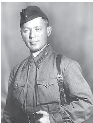
Шолохов Михаил Александрович